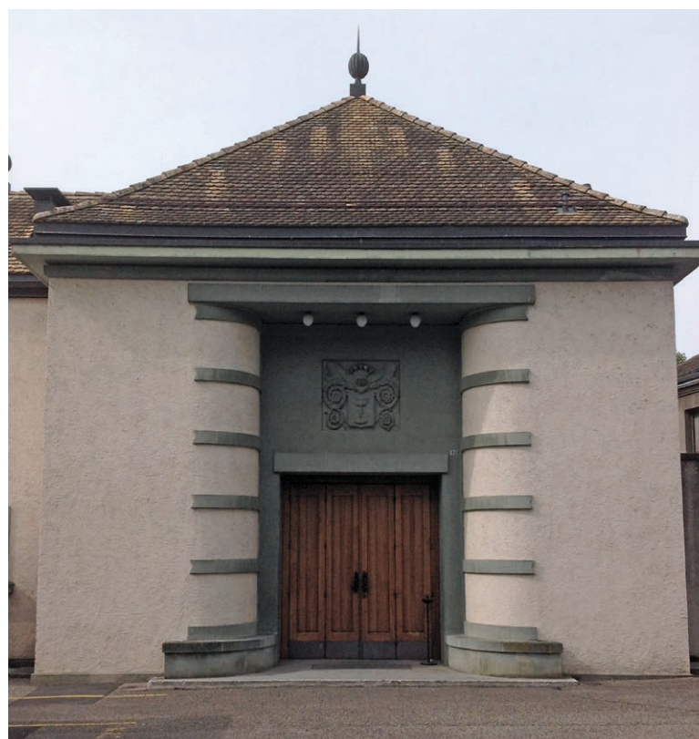
La salle communale où siège le Conseil communal

Nous rappelons à tous les habitants que les séances du Conseil communal sont publiques et que chacun peut venir y assister.