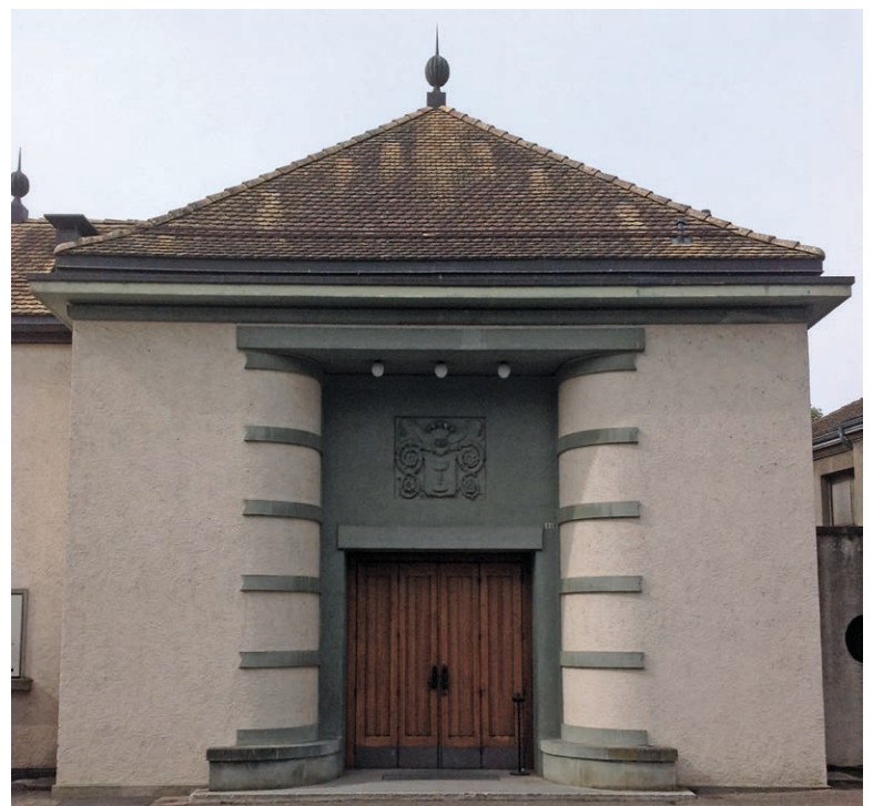
La salle communale où siège le Conseil communal

Nous vous rappelons que les séances du Conseil communal sont publiques et que chaque citoyen peut venir assister aux débats.