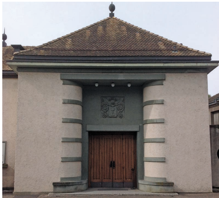
La salle communale où siège le Conseil communal

Nous vous rappelons que les séances du Conseil communal sont publiques et que chaque citoyen peut venir assister aux débats.