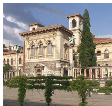
Le Palais de Rumine, siège du Grand Conseil

lence domestique et de prévenir et protéger les personnes qui en sont victimes. Elle propose une modification majeure dans le traitement des situations de violence en permettant aux policiers d'ordonner systématiquement à l'auteur de violence son éloignement immédiat du domicile conjugal.